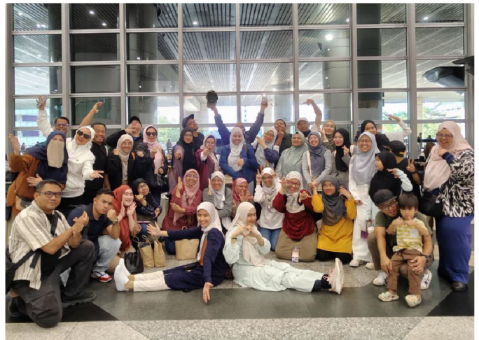
与团队成员参与 BE Leadership Meeting