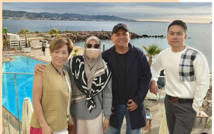
与导师一同前往米兰参加 BEST 奖励之旅