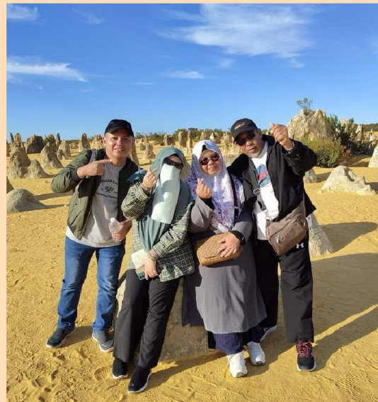
Membawa keluarga ke percutian BELT

"Anda perlu belajar sebelum mula menjana pendapatan (learn before you earn)," tegasnya kepada pasukan. Beliau sangat menekankan sistem bimbingan mentor, pembelajaran berterusan, dan pematuhan yang ketat terhadap peraturan syarikat sebagai pelan tindakan untuk mencapai kejayaan yang kekal lama.