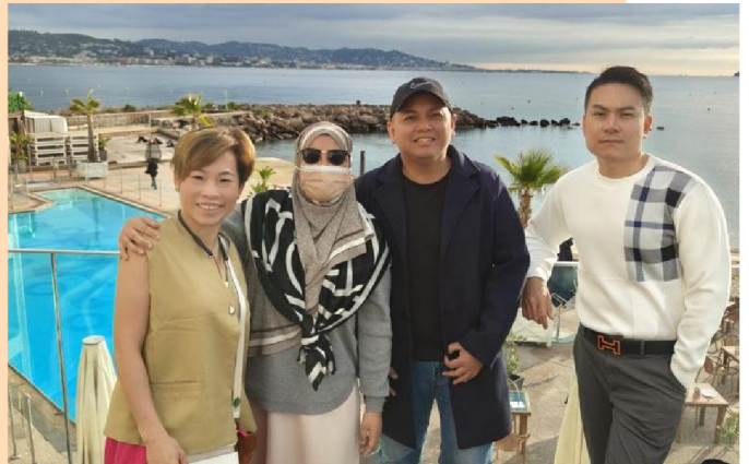
Melancong bersama ke MILAN BEST bersama para mentor kami