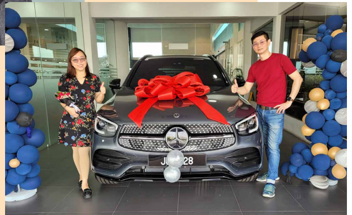
拥有梦想中的轿车

在亲身体验过出色的产品后，他们开始发展BE事业。只不过他们的BE事业并没有从此一飞冲天，