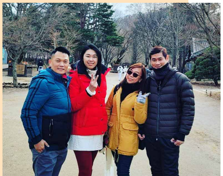
Gambar bersama Upline

Pandemik dan perintah berkurang berterusan pada 2020 telah meningkatkan keinginan mereka untuk berubah. Sebelum Cheat Min memutuskan untuk berhenti kerja di Brunei, beliau terlebih dahulu perlu mencari pendapatan yang lebih tinggi daripada gajinya, dan beliau merasakan ia suatu yang mustahil. Namun, pertemuan mereka dengan BE mengubah keraguan itu menjadi satu kepastian.