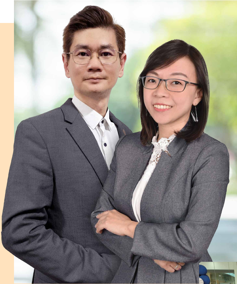
Gambar bersama Pengasas BE