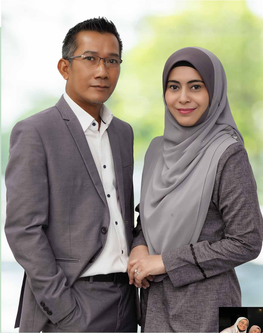
Gambar bersama Founder