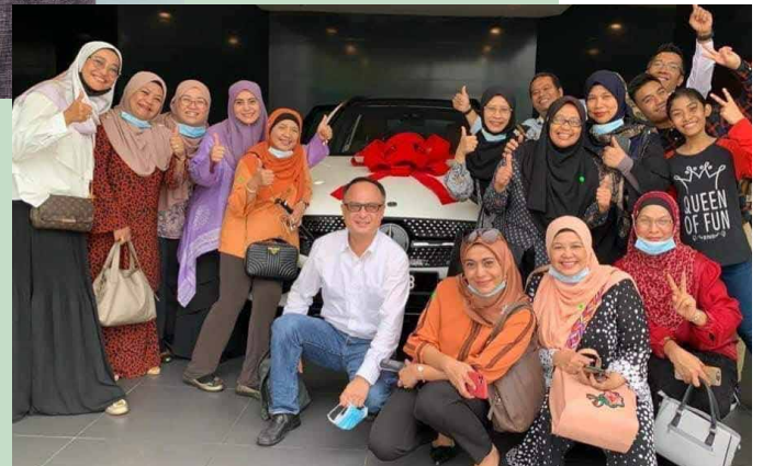
Membeli kereta impian saya