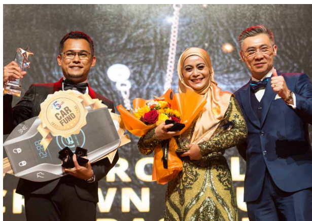
BE Convention 2022