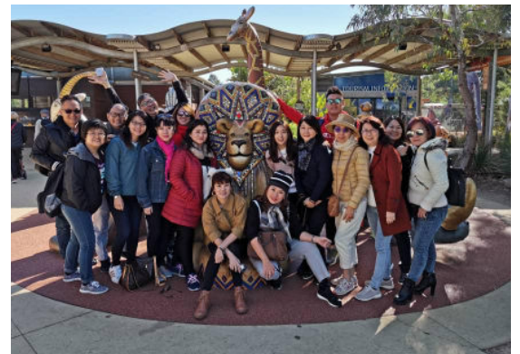
Kempen BE Lifestyle ke Melbourne