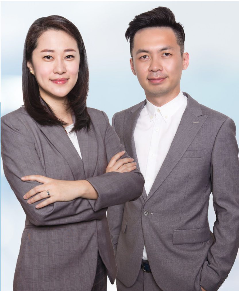
BE Lifestyle Travel 到迪拜