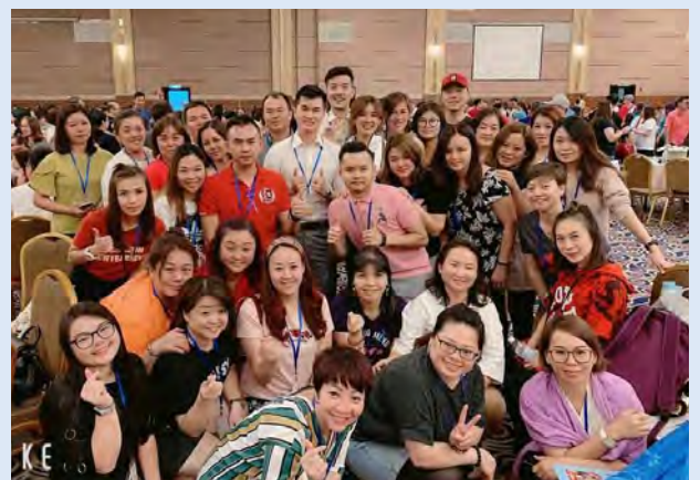
Gambar bersama upline dan IBO