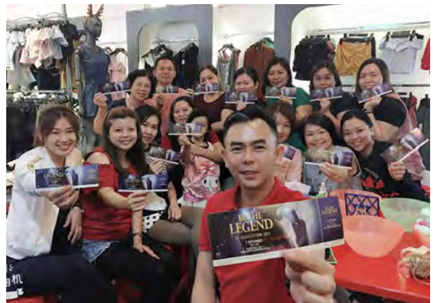
Bersedia untuk BE Legend