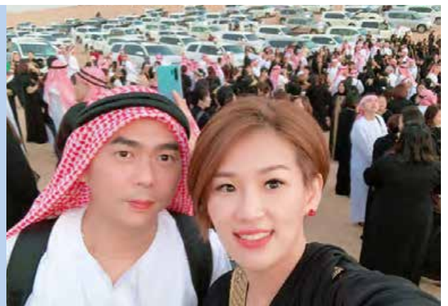
BE Lifestyle Travel ke Dubai

“Perniagaan BE kami mula berkembang maju. Malangnya, ayah saya tidak berada di sini untuk menikmati hasil kejayaan kami. Sementara masih ada masa, rebutlah peluang ini. Berusaha sekuat mungkin supaya anda boleh meraikan kejayaan anda bersama keluarga semasa mereka masih ada. Jangan tinggalkan penyesalan.”