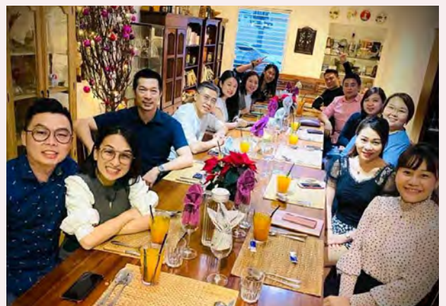
Gambar bersama upline