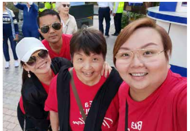
BE Lifestyle Travel ke Korea