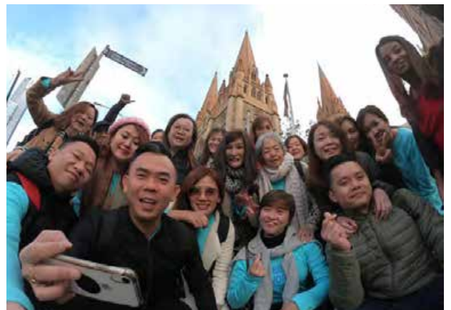
BE Lifestyle Travel ke Melbourne