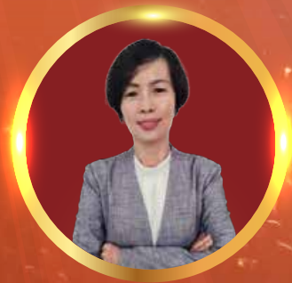
CCA LER SEE TIN / CHIA AH FUU