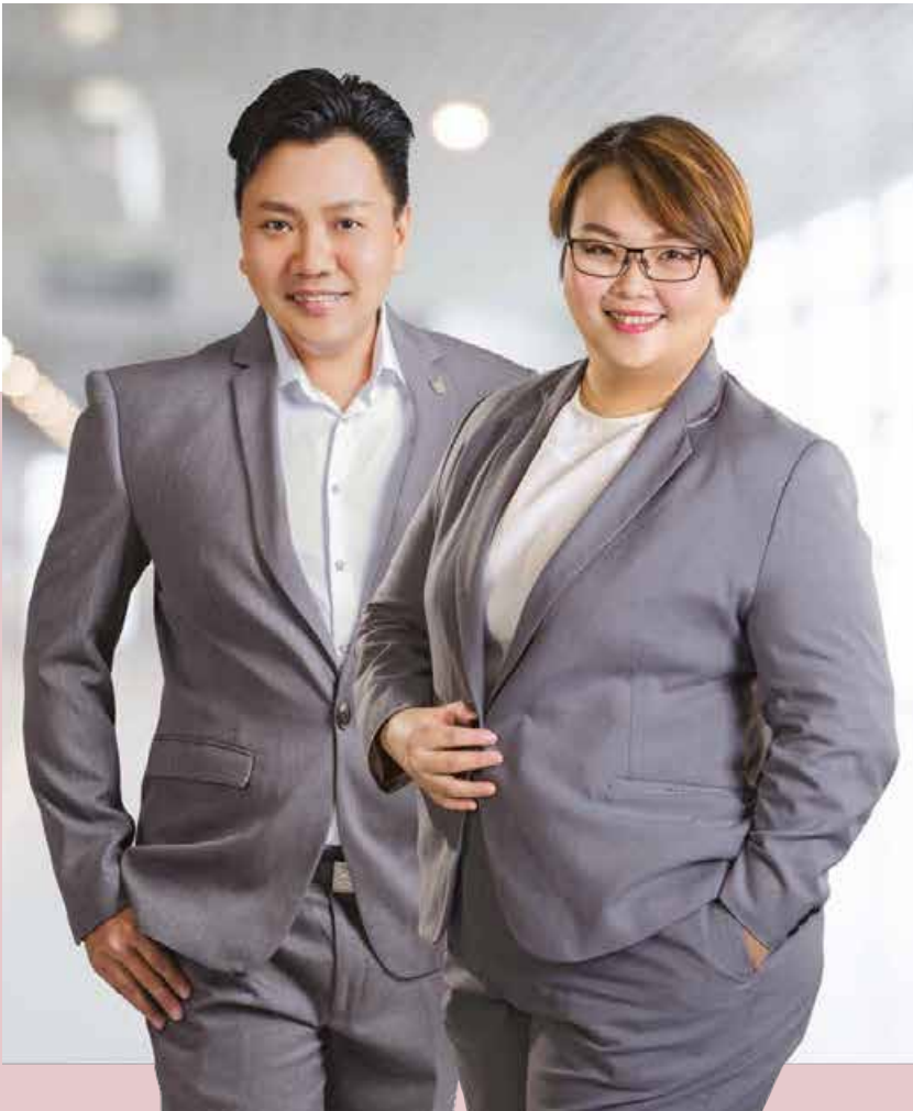
Gambar dengan pengasas