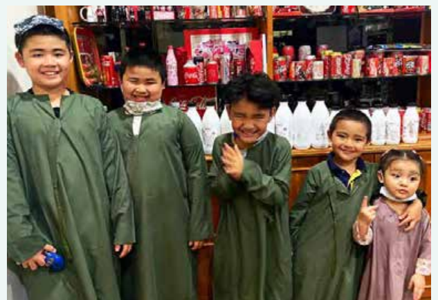
Anak kesayangan saya