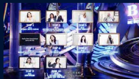
Top Sponsor Achiever Q3 & Q4