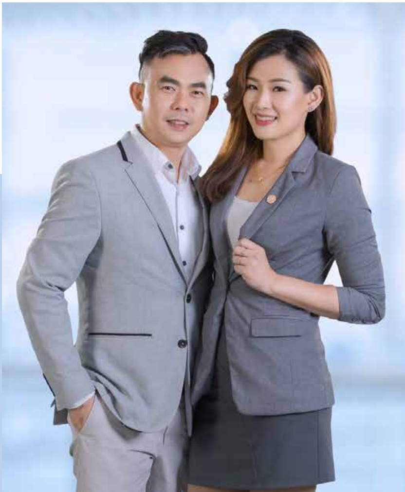
Menghadiri majlis syarikat