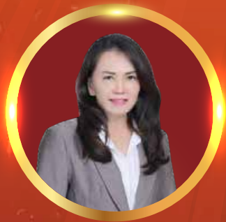
CCA TO SIAUW JEN