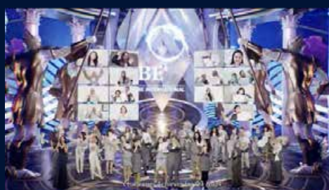
Finale dengan semua penyampai & pencapai

VSAN Event video: https://www.facebook.com/belegendsbeintl/videos/1344029442725547