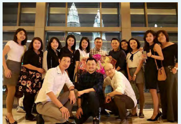
Makan malam dengan Founder dan IBO