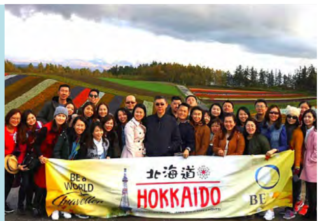
BE Lifestyle Travel ke Jepun