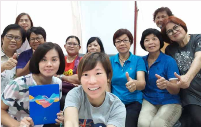
Gambar bersama upline