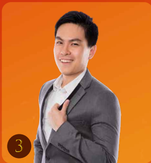
RCCA TY LOW