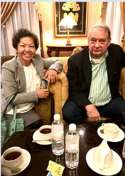
Gambar dengan Nobel Laureate Dr. Ferid Murad

peluang kepada saya untuk terus menyumbang kembali kepada masyarakat dengan menolong lebih banyak orang menjadi pemimpin, membina kerjaya mereka, menikmati hidup yang sihat dan bahagia.”