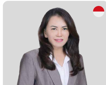
TO SIAUW JEN