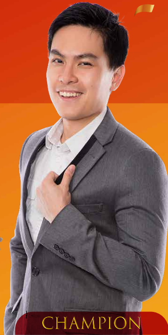
CHAMPION RCCA TY LOW