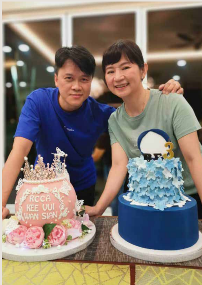
Meraikan pencapaian RCCA

Adalah normal bagi pemula MLM untuk berjuang dan menyesuaikan pemikiran mereka, terutama jika mereka biasa bekerja di dalam kubikel. Dan pada mulanya, penolakan dapat melemahkan semangat mereka dengan mudah.