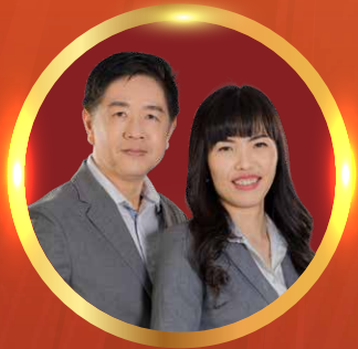
CCA CHANG BOON CHUI / SONG HUA HUI