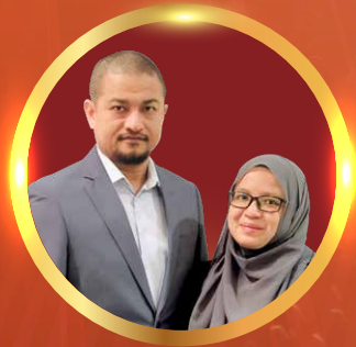
CCA AFROHAH ABD HAMID / MOHD NASIR CHE EMBREE