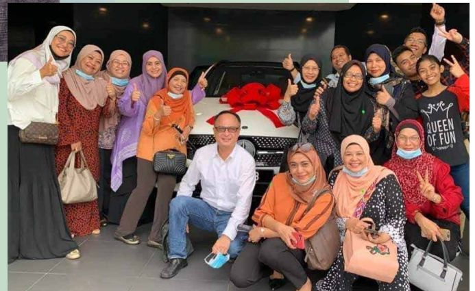
Membeli kereta impian saya