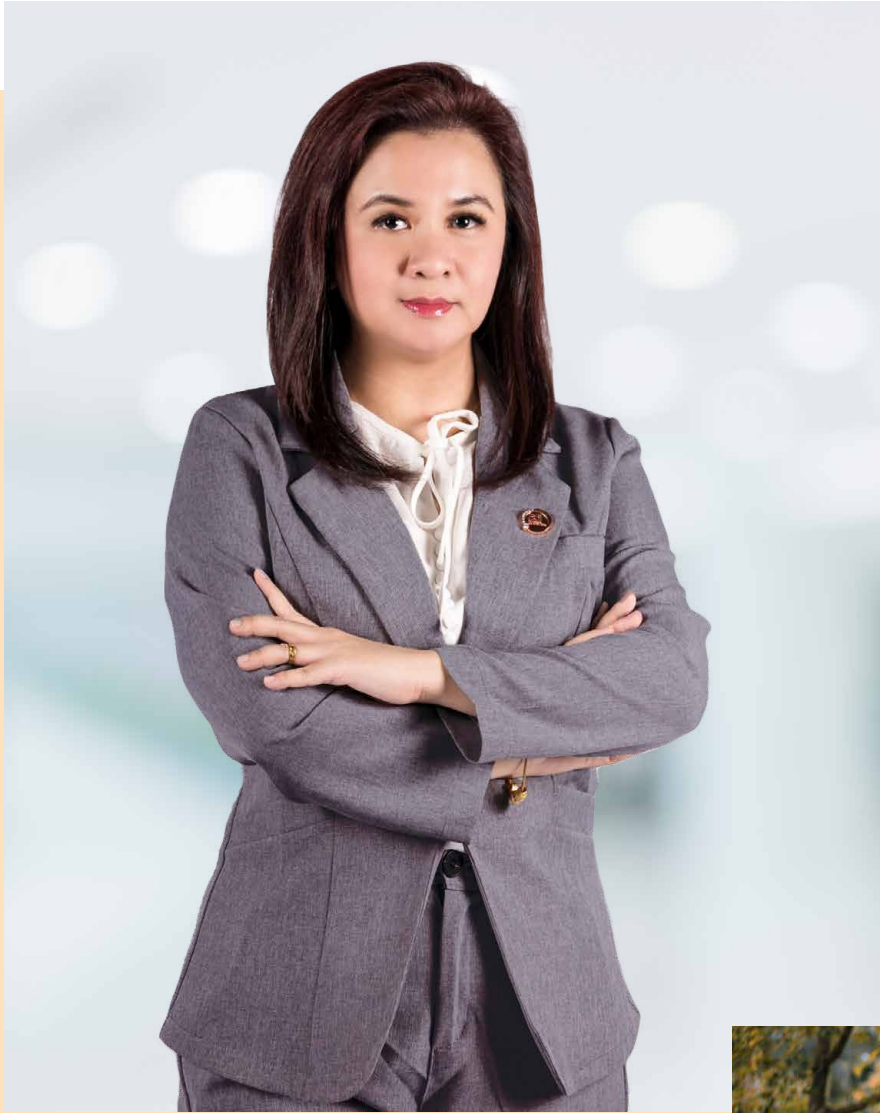
Gambar bersama Founder